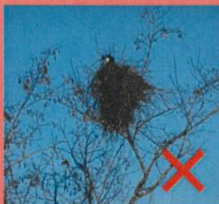
Nid de pie