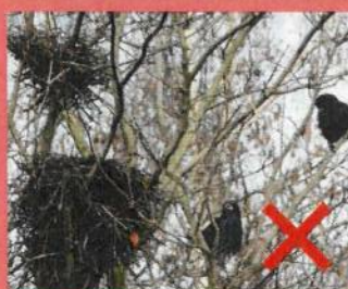
Nid de corbeau freux